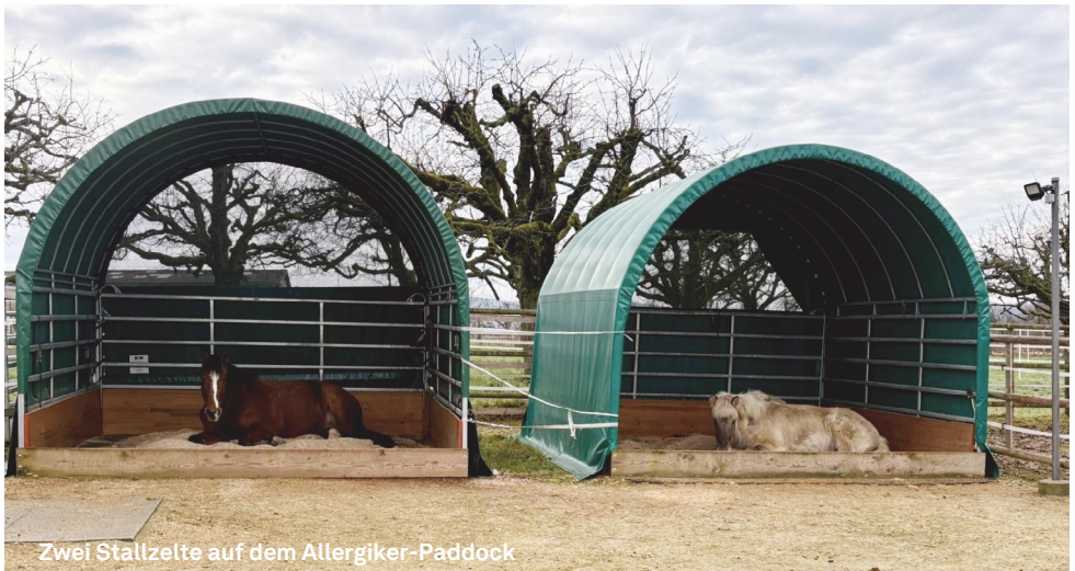
Zwei Stallzelte auf dem Allergiker-Paddock

Die umgesetzten Infrastrukturprojekte leisten einen wichtigen Beitrag zum Tierwohl und zur nachhaltigen Weiterentwicklung der Anlage.